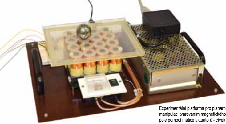
Experimentální platforma pro plánání manipulaci tvarem pomocí matice aktuátorů - cívek