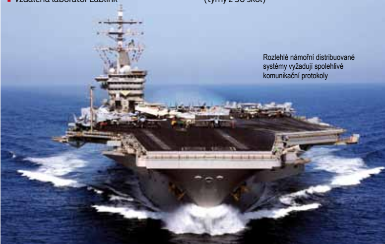
Rozlehlé námořní distribuované systémy vyžadují spolehlivé komunikační protokoly