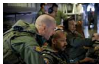
US Navy Office of Naval Research supports our research activities