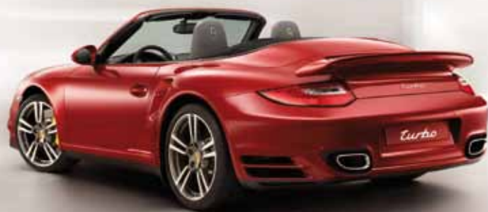
Vývoj řídicího systému pro Porsche Engineering Services

Honeywell, Rockwell Automation, Siemens, WAGO, Porsche Engineering