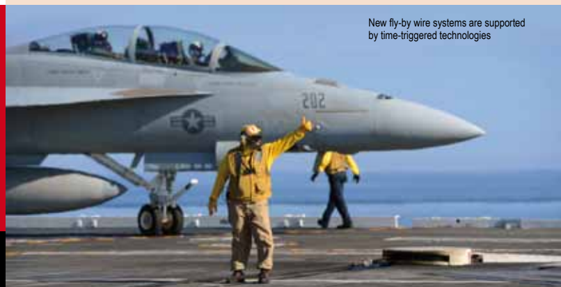
New fly-by wire systems are supported by time-triggered technologies