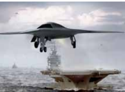
Výzkum efektivních komunikačních protokolů pro US Navy